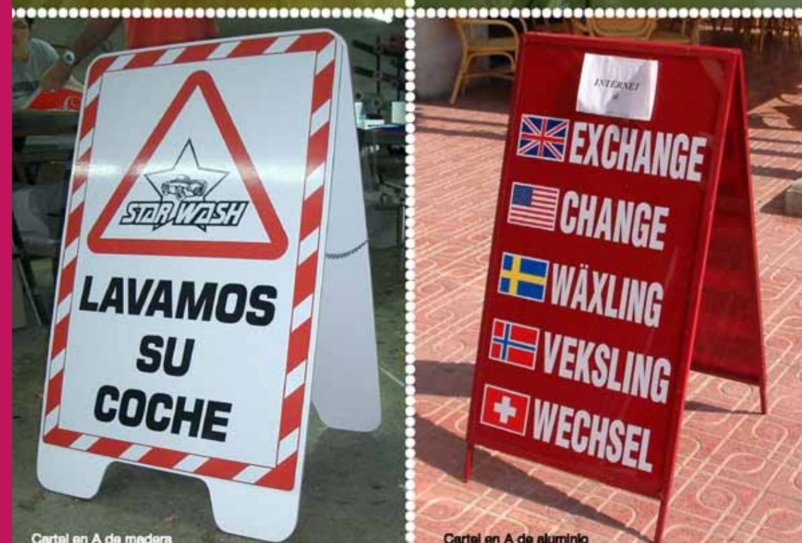
Cartel en A de madera