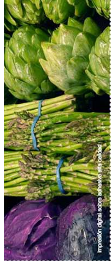
Impresión digital sobre adhesivo alta calidad