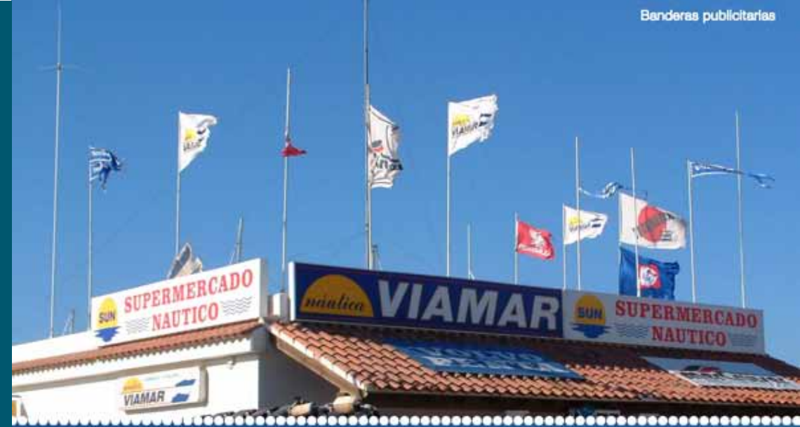
Banderas gran formato