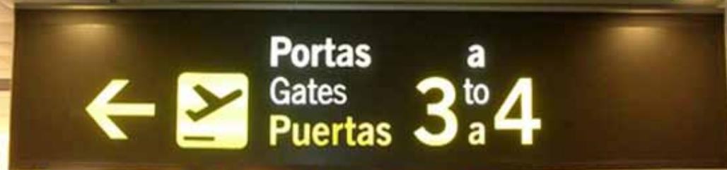
Cartel con luminaria