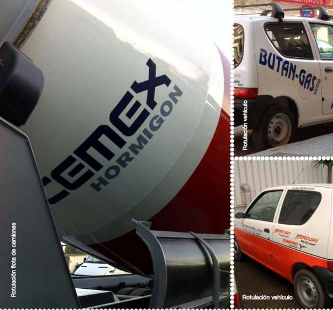
Rotulación flota de camiones