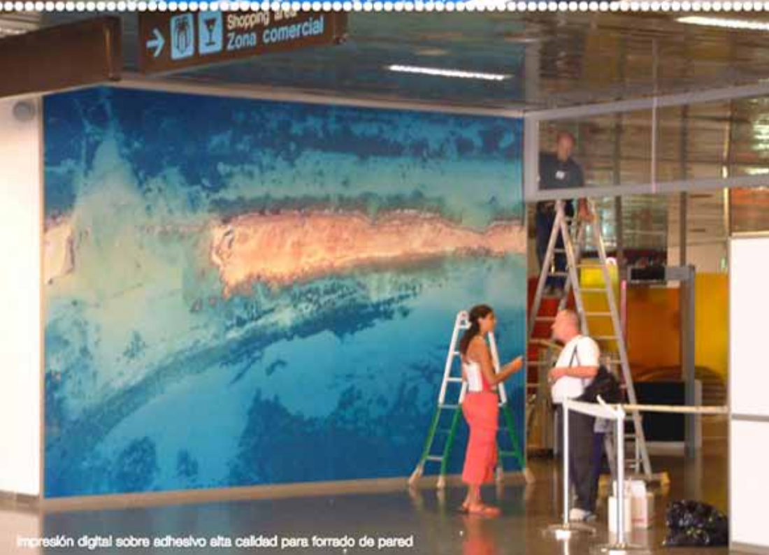
Impresión digital sobre adhesivo alta calidad para forrado de pared