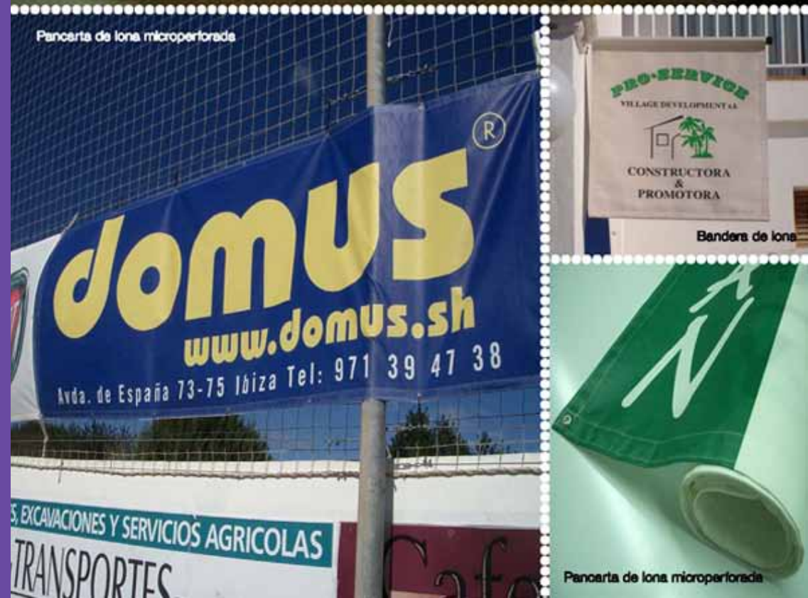
Pancarta de lona microperforada