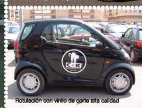
Rotulación con vinilo de corte alta calidad