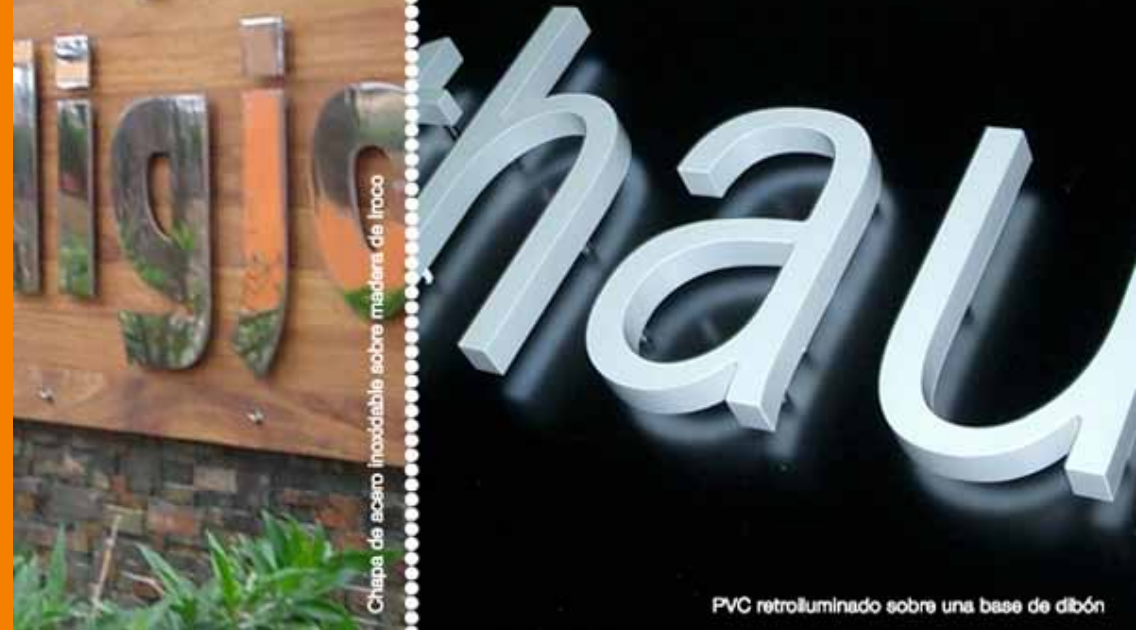
PVC retriluminado sobre una base de dibón

Chapa de acero inoxidable sobre madera de iroco