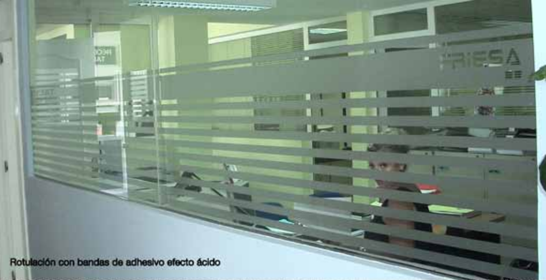
Rotulación con bandas de adhesivo efecto ácido