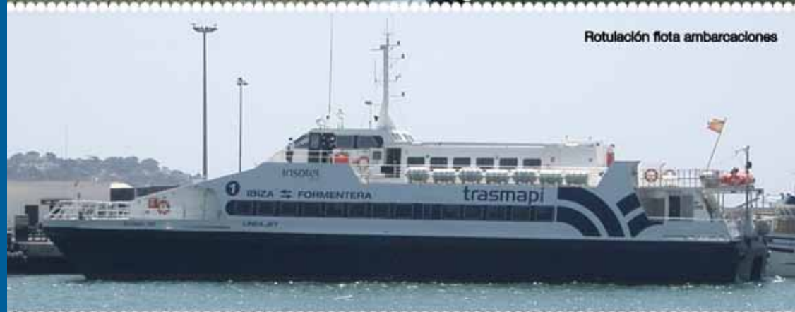
Rotulación flota embarcaciones