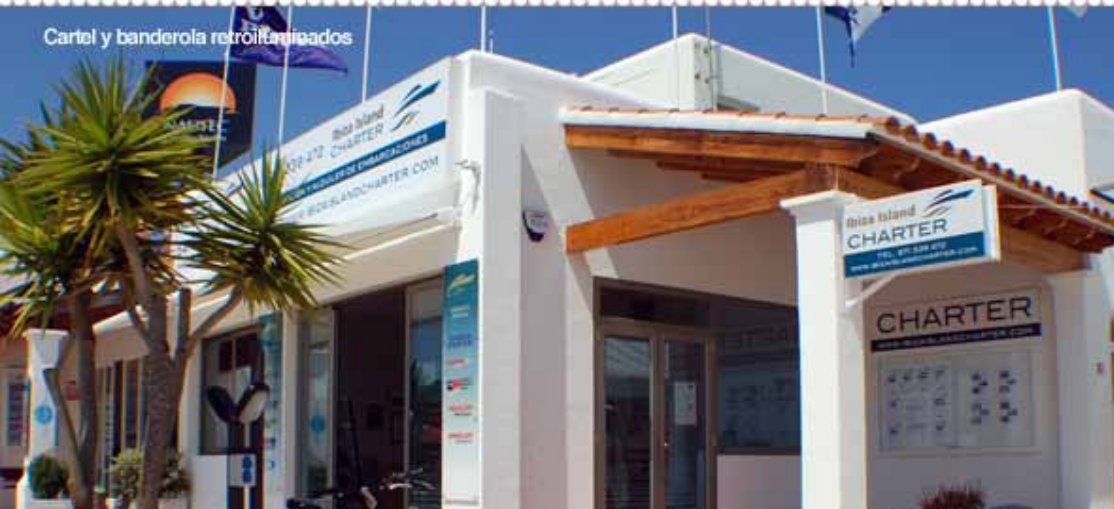
Cartel y banderola retroiluminados