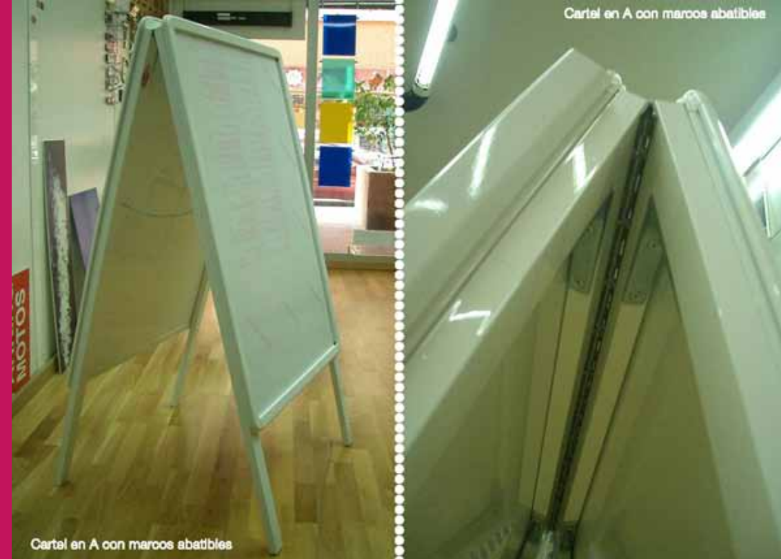
Cartel en A con marcos abatibles