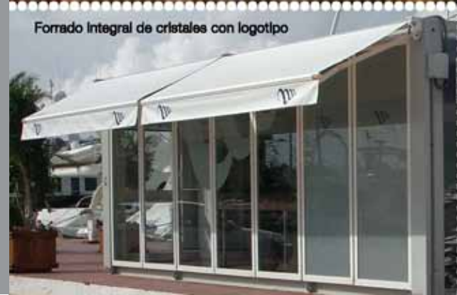
Forrado Integral de cristales con logotipo