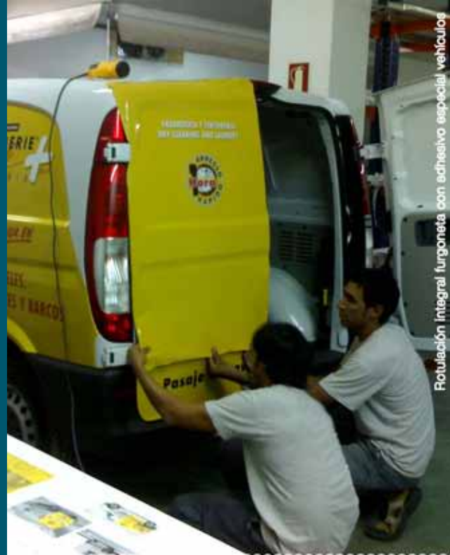
Rotulación integral furgoneta con adhesivo especial vehículos