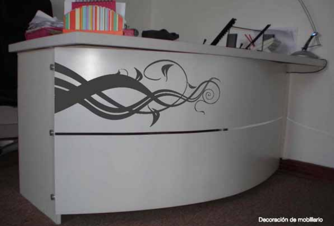
Decoración de mobiliario