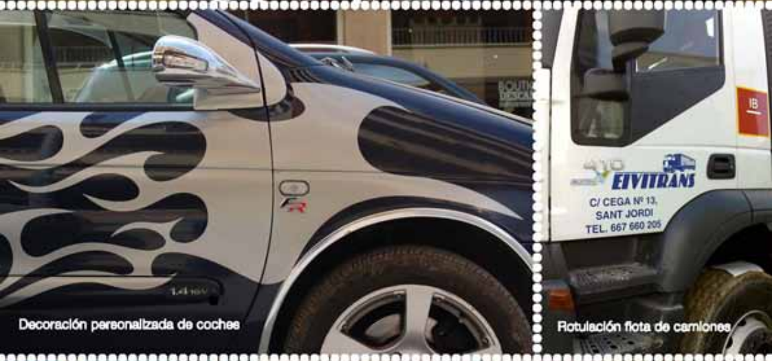
Decoración personalizada de coches