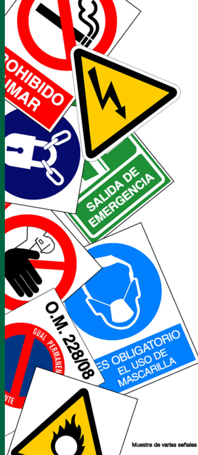
Muestra de varias señales