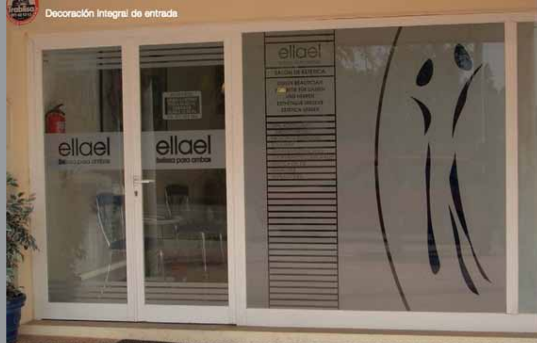
Decoración Integral de entrada