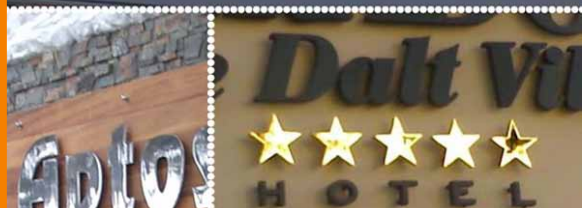
Estrellas: latón en baño de oro Letras: PVC pintado en oxidón