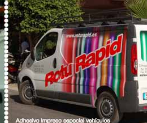
Adhesivo Impreso especial vehículos