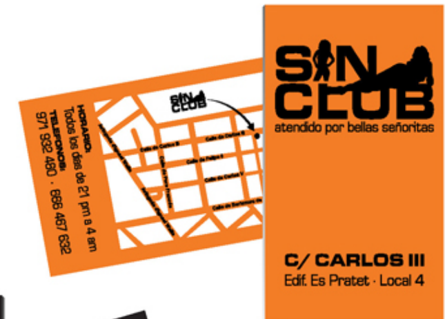
Diseño de tarjeta y logo