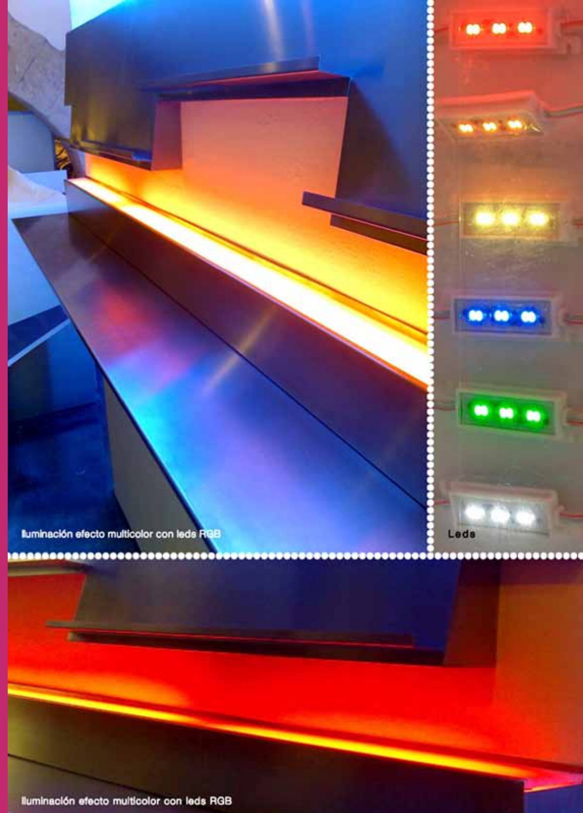
Iluminación efecto multicolor con leds RGB

Gran ahorro de energía Bajo consumo Larga vida Bajo mantenimiento Gran variedad de color