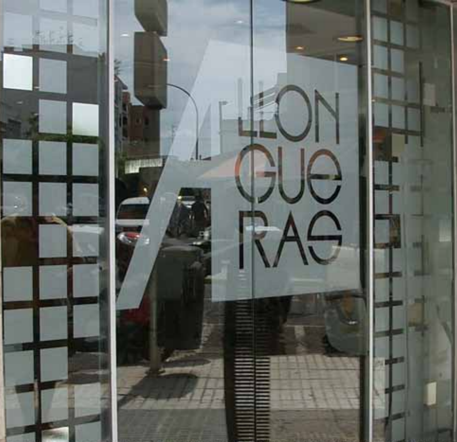
Decoración con anagrama corporativo y combinado de adhesivos