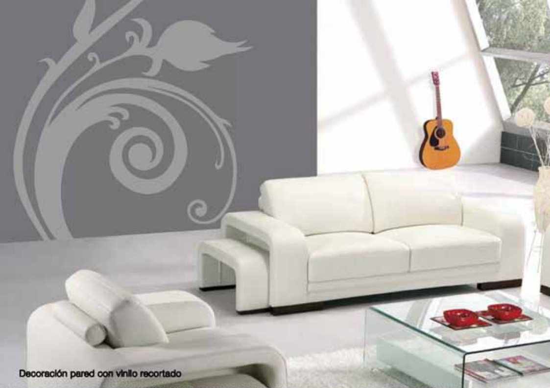
Decoración pared con vinilo recortado