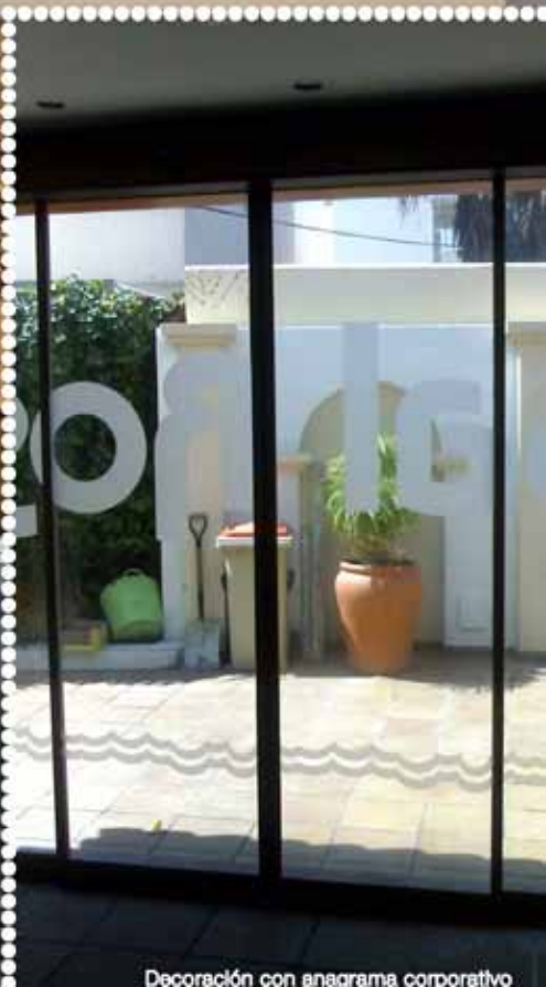
Decoración con anagrama corporativo