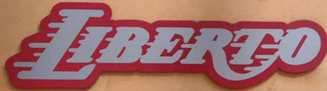
Cartel de PVC recortado

Ponemos a su disposición una amplia gama de materiales para realizar cualquier trabajo siguiendo sus directrices corporativas..