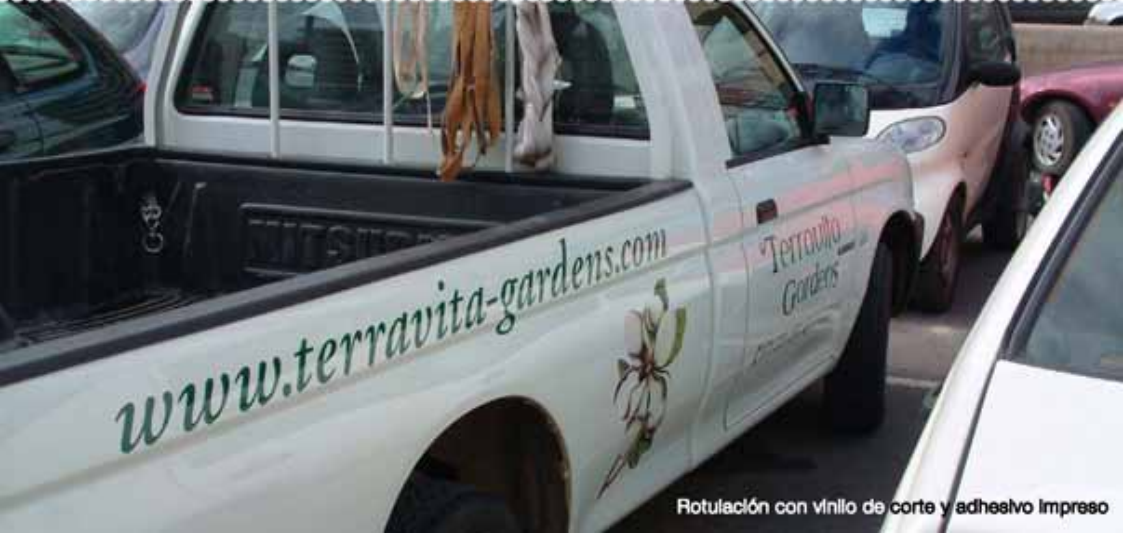
Rotulación con vinilo de corte y adhesivo Impreso