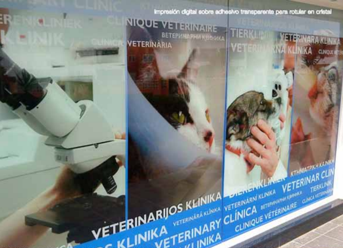
Impresión digital sobre adhesivo transparente para rotular en cristal