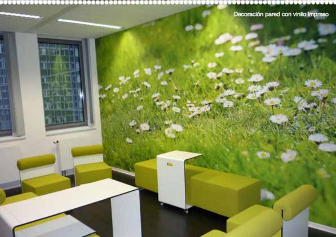
Decoración pared con vinilo impreso