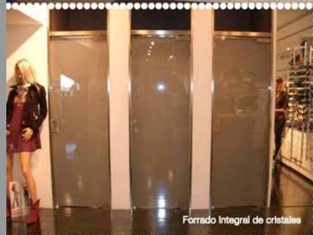
Forrado Integral de cristales