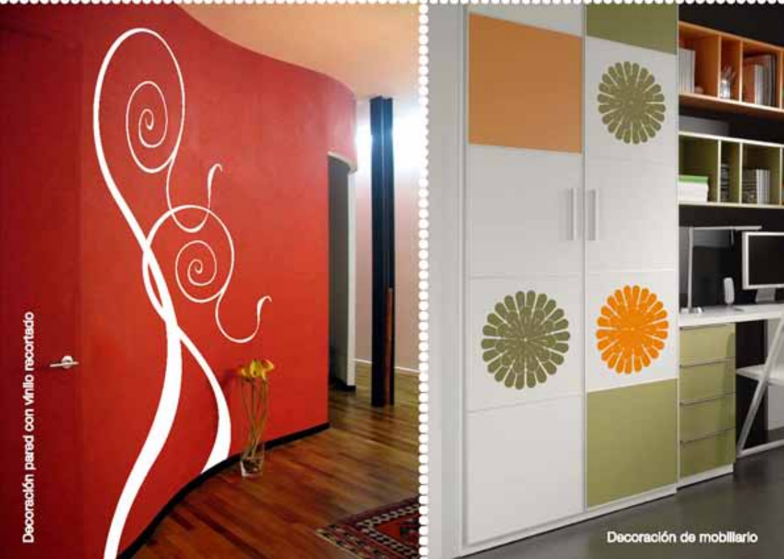
Decoración pared con vinilo recortado