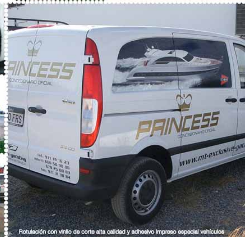
Rotulación con vinilo de corte alta calidad y adhesivo Impreso especial vehículos