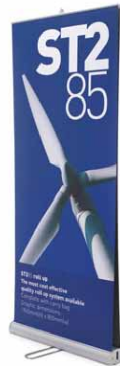
Roll up doble cara