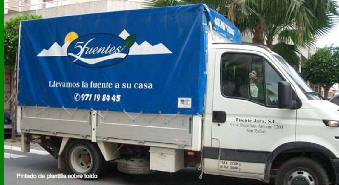
Pintado de plantilla sobre toldo