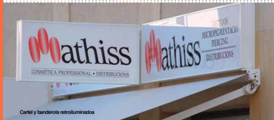
Cartel y banderola retroiluminados