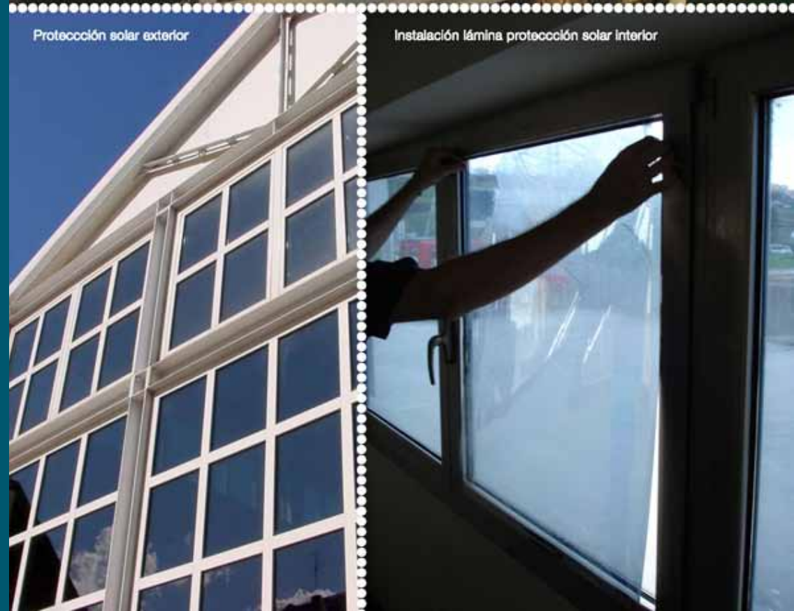
Protección solar exterior