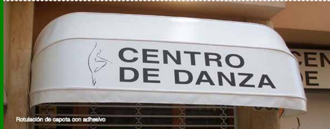
Rotulación de capota con adhesivo