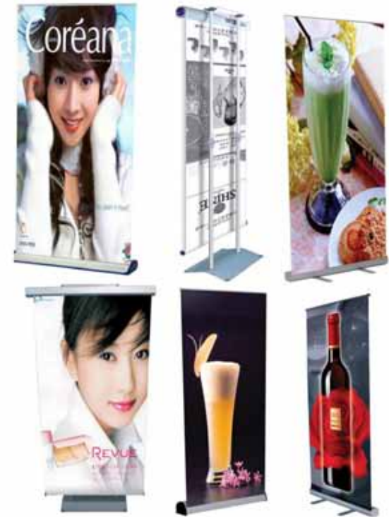
Modelos varios de roll up