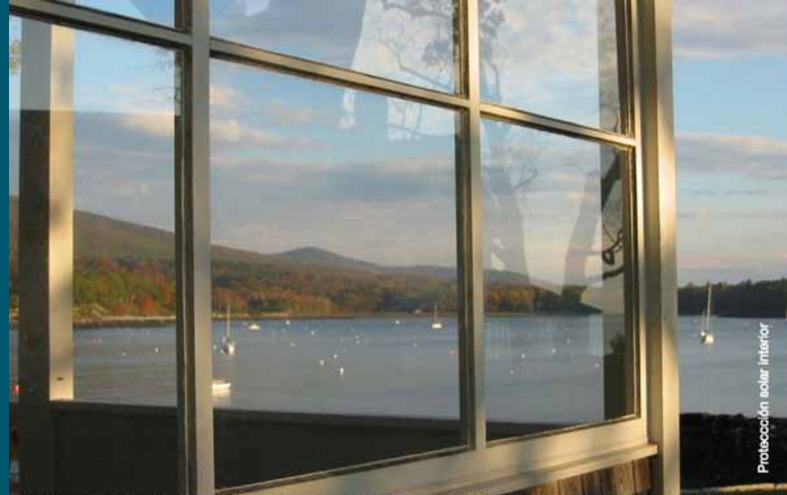
Protección solar interior

Color: azul o verde por la cara exterior del edificio ( + características primer material )