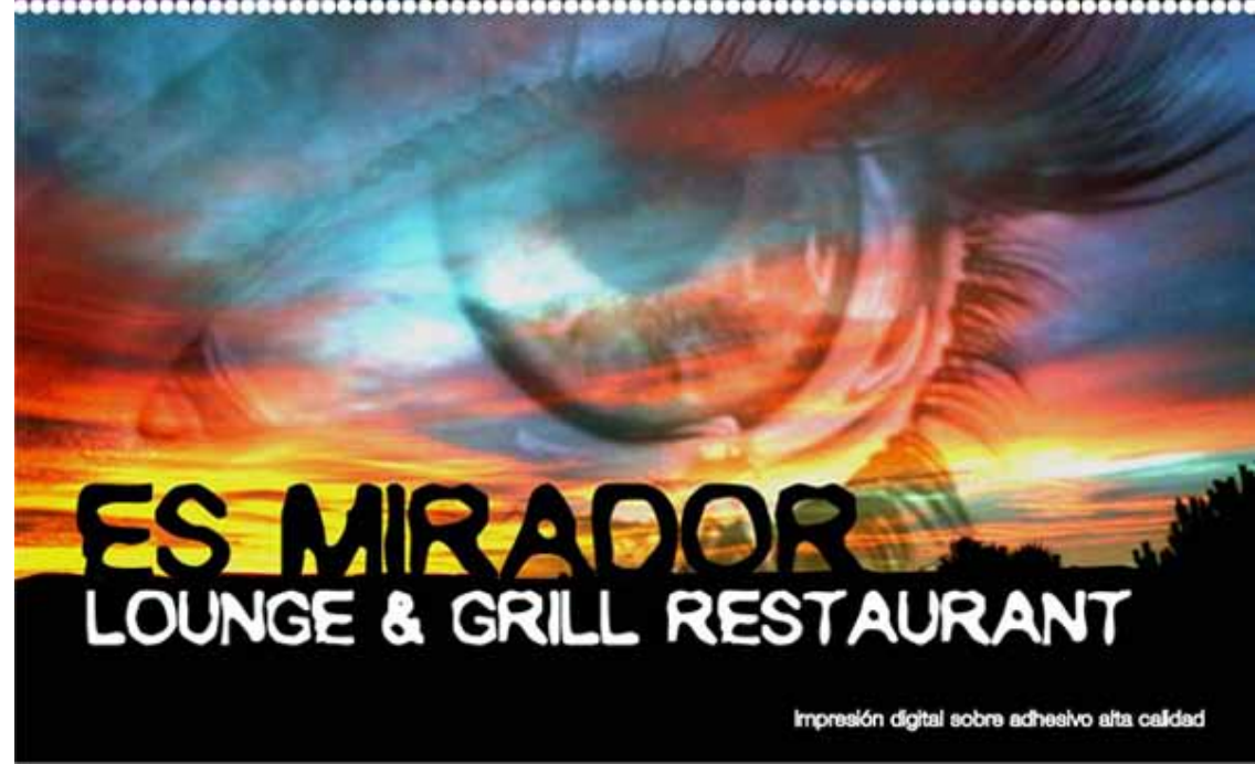
Impresión digital sobre adhesivo alta calidad