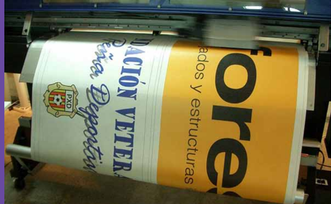
Impresión digital de pancartas con lona microperforada