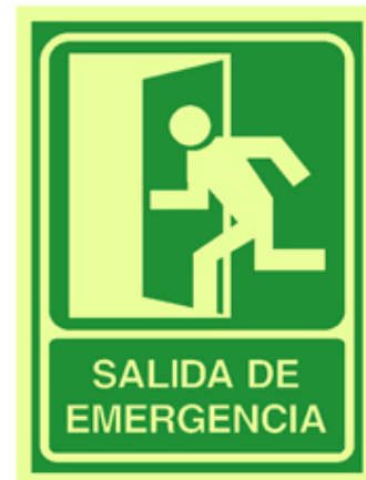
Señales con fondo fotoluminiscente