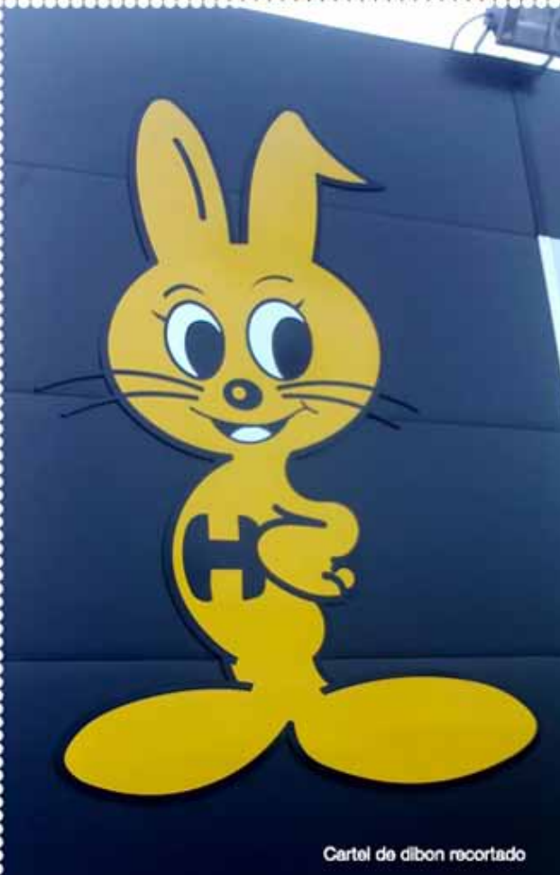
Cartel de dibon recortado