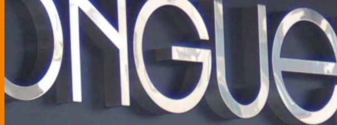
Acero inoxidable macizo brillante sobre una base de dibón

Acabados: mate, brillo, metalizado, poroso, oxidado, craquelado, difuminado.